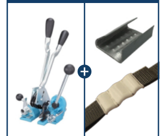
Precinto de Chapa