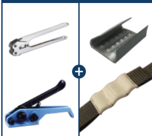
Precinto de Chapa